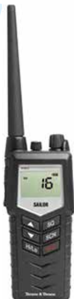
Eksempel på en bærbar VHF