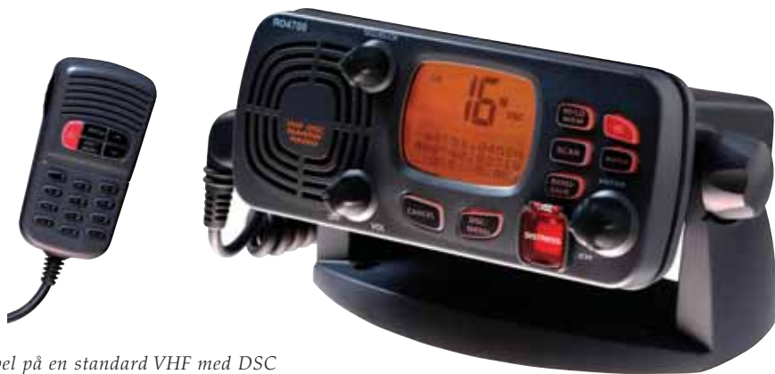
Eksempel på en standard VHF med DSC