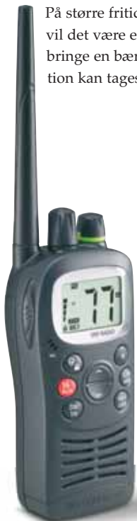
Eksempel på en bærbar VHF

På større fritidsfartøjer med redningsflåde vil det være en ekstra sikkerhed at medbringe en bærbar VHF, som i en nødsituation kan tages med over i redningsflåden.