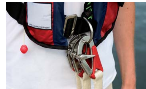
D-ring og livliner

Søsportens Sikkerhedsråd anbefaler, at man til al fritidssejls køber en vest med indbygget sikkerhedssele med D-ring og tilhørende CE-godkendt livline samt skridtrem.