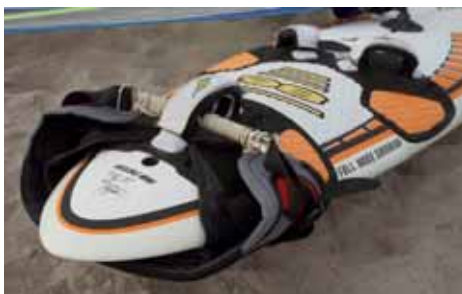
Trapezen anvendt som "nødfinne"