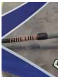
Reserveline på bommen