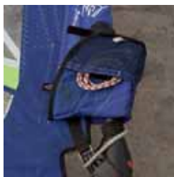
Reserveline i mastelommen

En reserveline, der kan surres fast på bommen, trapezkrogen eller gemmes i mastelommen kan blive nyttig i en kritisk situation. Linen kan f.eks. surre mast, sejl og bom sammen i tilfælde af havari, erstatte ødelagte liner og holde iturevne dele sammen, samt bruges som slæbeline. Det anbefales at medbringe mindst 5-6 meter line.