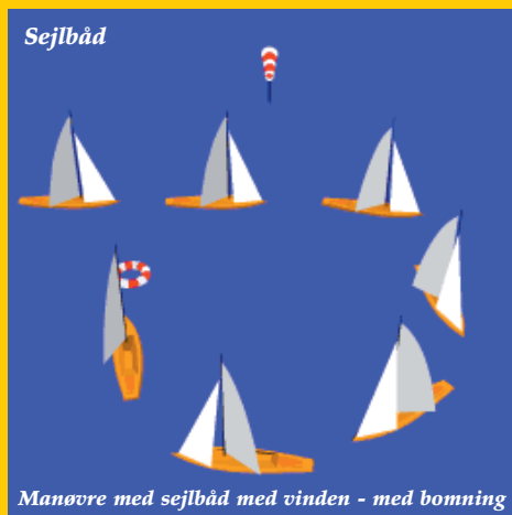
Manøvre med sejlbåd med vinden - med bomning

Drej båden og styr med vinden. Sejl 50 til 100 meter med vinden, drej båden skarpt rundt og tag gassen af motoren. Styr op mod vinden og læg båden på vindsiden tæt ved den overbordfaldne. Sæt motoren i frigear og lad vind og bølger standse båden. Brug aldrig skruen, når du er i nærheden af den overbordfaldne.