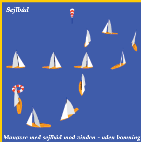
Manøvre med sejlbåd mod vinden - uden bomning

Hvis der er motor i sejlbåden anbefales det altid at starte motoren straks og stryge sejlene for nemmere og hurtigere at komme hen til den overbordfaldne. Brug dog aldrig skruen, når du er i nærheden af den overbordfaldne.