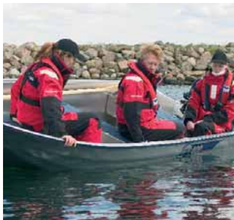
Afprøvning af stabiliteten i en jolle.