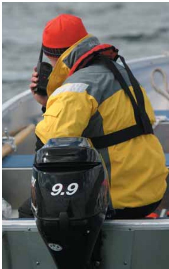
Check om speedbåds kørekort er påkrævet.

6. Sidst – men ikke mindst – når du har besluttet dig, så prøv jollen i vandet. Det er ikke lige så nødvendigt ved køb af nye joller, der er godkendt efter EU-normerne, som det er ved køb af brugte joller, men gør det alligevel. De fleste mennesker køber jo heller ikke ny privatbil uden først at køre en prøvetur.